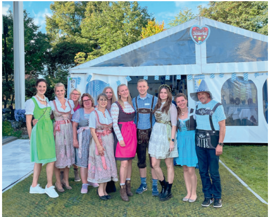
Das ServiceCenter Lübeck in festlicher Tracht

Anfang Oktober hieß es für unsere Mitglieder endlich wieder „O'zapft is“. Das erste Mitgliederfest für unsere neuen Mitglieder aus unserem Neubau im Westpreußenring 12 – 22 sowie für die Mitglieder aus den Häusern im Westpreußenring 2 – 10 und 24- 28, deren Wohnhäuser bereits vor einigen Jahren modernisiert wurden.